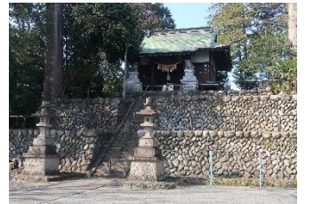
河原石で組まれた熊野神社 の境内