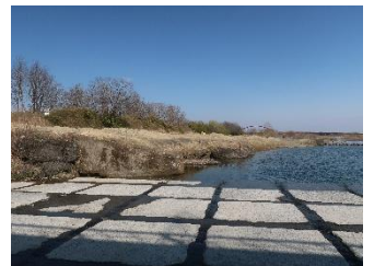
アキシマクジラの化石 発掘地