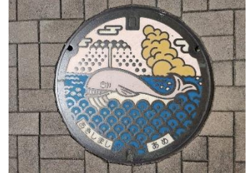
アキシマクジラがデザイン されたマンホールの蓋

今回は、これらの出来事の現場を訪ねつつ、地元の人々の生活に関連した神社・寺院も併せて訪れる多摩めぐりです。