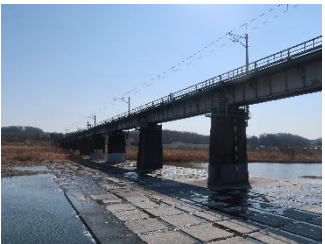
列車衝突事故現場

第57回多摩めぐり(2025.10.12)で日野用水取水堰を訪ね、多摩川やそれを渡る八高線ののどかな鉄橋風景を眺めました。今回の多摩めぐりは、多摩川をはさんで反対側の昭島市側の河原周辺を巡りながら、のどかな風景の中で起こったいくつかの昭和の大きな出来事の跡を訪ねます。