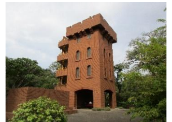
六道山公園展望台