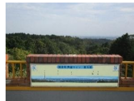
展望台からの見晴らし