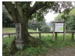
六道の辻に立つ庚申塚