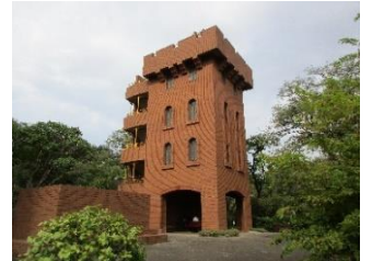
六道山公園展望台