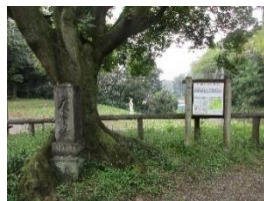
六道の辻に立つ庚申塚