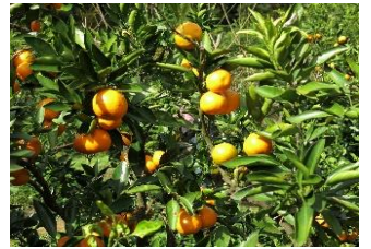
下田みかん園のミカン

日光街道と青梅街道の宿場として栄えた瑞穂町箱根ヶ崎を西端とする狭山丘陵は、武蔵野台地にポツンと残った丘陵。東端は所沢市・東村山市に至り、東西 11 km、南北 4 km、総面積 3,500ha。この丘陵の生い立ちは、古多摩川が作った三角州が約 50～100 万年前から始まった地殻変動と多摩川の浸食、流れの変化で残った丘陵と言われています。