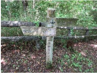
お伊勢山遊歩道道しるべ