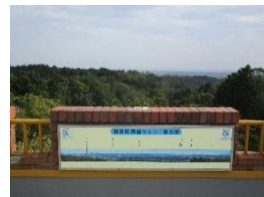
展望台からの見晴らし