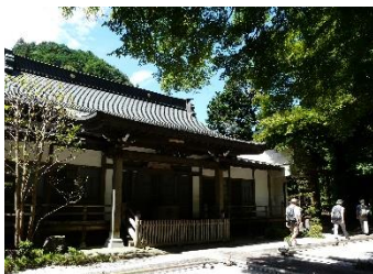
ほうしゅうじ 寶珠寺本堂