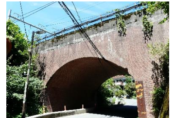
中央本線レンガアーチ