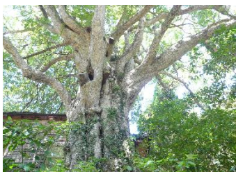
寶珠寺のカゴノキ

江戸を防衛するために徳川 2 代将軍秀忠の時代の慶長 9 年 (1604) に整備した五街道の一つ旧甲州街道の八王子市・小仏 (こぼとけ) 峠には戦国期には小仏関所があった (後に駒木野に移された)。その麓の小仏宿は駒木野宿と 15 日間ずつ交代で継立てを行い、日本橋から 12 番目の宿場機能を果たす武蔵国最後の宿場であった。信州高遠藩 (伊那市)、高島藩 (諏訪市)、飯田藩 (飯田市) の参勤交代の往還路であり、飛脚も走った。高尾山詣での表参道でもあり、人馬の賑わいぶりが見て取れる馬頭観音が今も立つ。