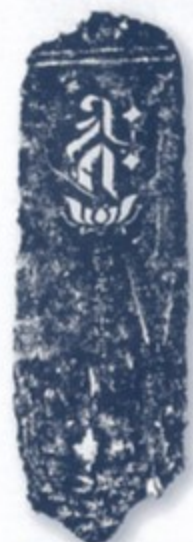
正和元年(1312)板碑拓本

日野市郷土資料館では、平成27年度から豊田村の旧名主家の資料調査を進めてきました。それにより、日野市域では最も古い文禄3年(1594)の検地帳の原本や、麦酒醸造関係の資料が新たに発見され、また平成30年度には、大正時代末期の方