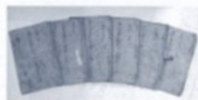
文禄3年(1594)の検地帳 (山口高央家所蔵)