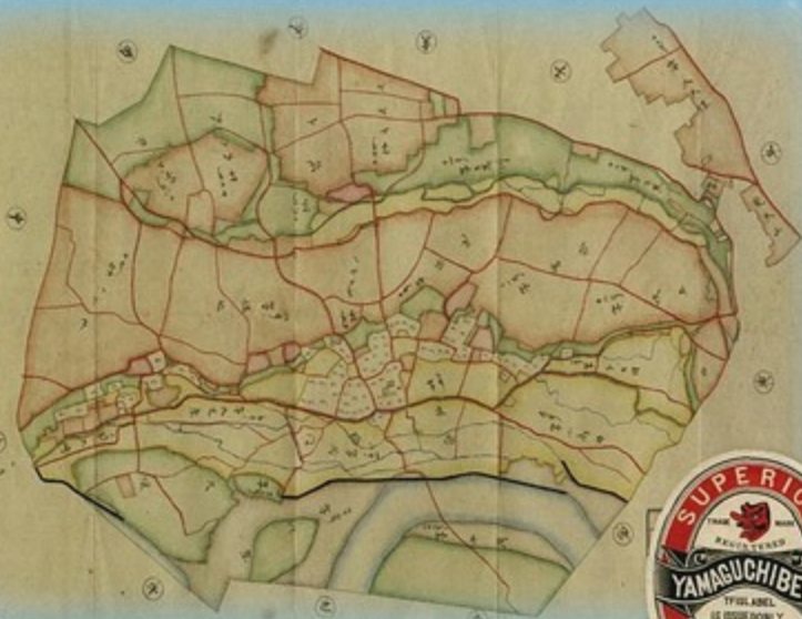
明治期の豊田村絵図