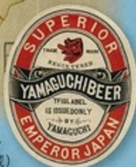
山口麦酒レッテル (山口高中央家所蔵)