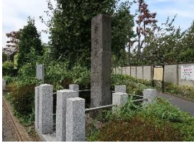
文字庚申塔（五日市街道）

多摩を深める 中世の道・参詣の道 深大寺街道～ 沿道に刻まれた人々の思いと歴史をたどる