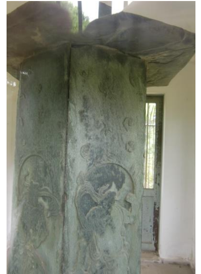
普濟寺の国宝「六面石幢」

ハケを防壁として中世の立川地域で活躍した豪族の立川氏。その館の面影を境内に残す古刹、普濟寺。当寺の国宝「六面石幢」を拝観する。