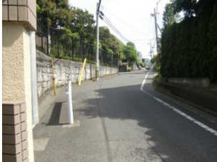
立川崖線のハケ道